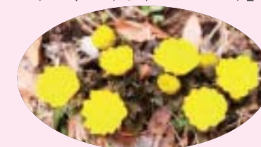
花言葉: 幸せを招く