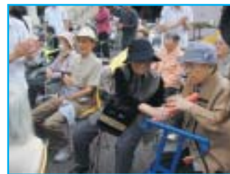
バトンリレー& サッカーゴール 入れ競争